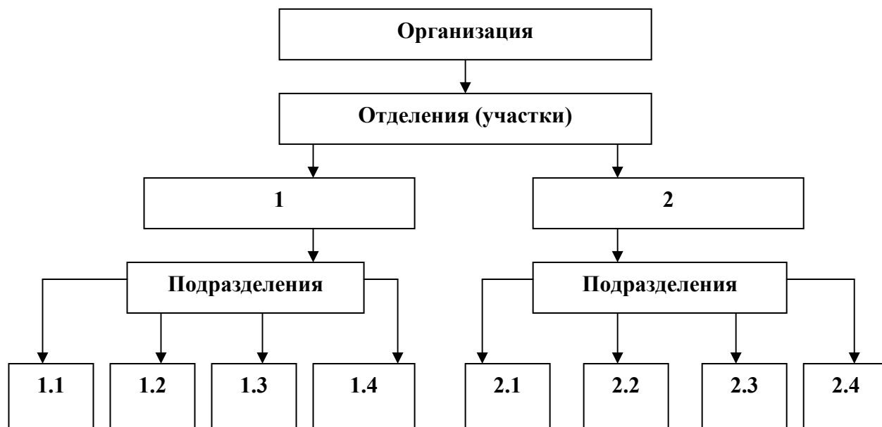
Рисунок 2.1 - Трехступенчатая организационная структура хозяйствующего субъекта